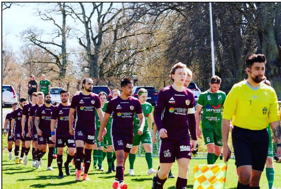
Klubben som äntligen kunnat se frukten av allt arbete.

Vi har haft ett antal tillfällen under året som både är på plan men även utanför. Nationaldagen, Lions cup, OIF Company cup, Veteran KM, Fotbollsskolan, Metalldagen, Julmys i byn, Inomhus KM och Idrottens Dag är några av klubbens aktiviteter som inte bara skapar god stämning utan en gemenskap och ett ansikte utåt åt föreningen. Vi har