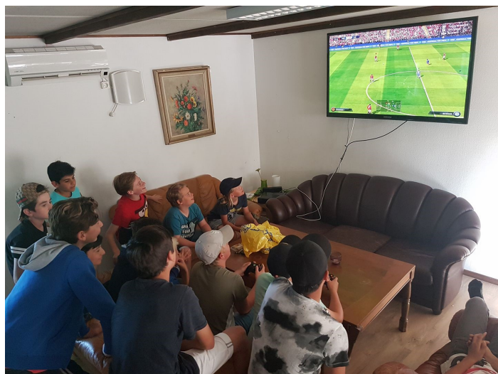
Lite avkoppling och X-box är aldrig fel tycker grabbarna i Pojkar 13-14.