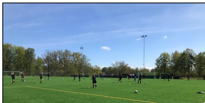
Träning tillsammans med OIF/BK Unions damlag uppe på Brunnssängen

Vi avslutade säsongen med Paddel i motionshallen