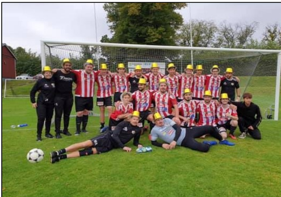
Drömmen om serieseger och ett första steg på vandringen uppåt i seriesystemet gick över förväntan då avancemanget till div5 var odiskutabel.

Serien: Våra förväntningar hade kanske höjts något med alla nytillskott vi fått men det var fortfarande